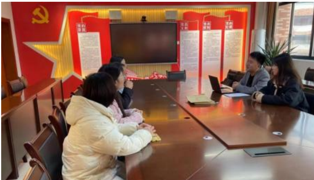
图 校企开展学术研讨项目交流会议

公 高度 队的 ，充分 到 和 的关 ，对 高 和 关 的 。此公 供 ，包 更 、 方法 及 导 发 程，并 持 丰富 的 家 过 、 会和 际案 ， 队 分 的 和 。 常 地 活动， 包 参加 会 、 等 ， 促 回 的 分 ， ， 并 的 队 ( )。