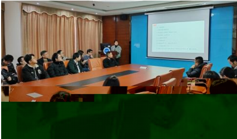
图 员工专业技能培训

，公 促 发 和 才 方 得 成 。 过 创 的 和 ， 不 动 公 的 持 成长， 工 供 的发 机会。 过 供多 化的 和发 ， “ 队 共 ” 等 活动 ( )， 帮 工 ( 技 和管 ； 并 的 和 规划， 工的 合 和 ， 包 导 发 计划、技 技 及 部 等， 地促 工的 方 发 。